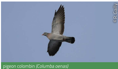
pigeon colombin ( Columba oenas )