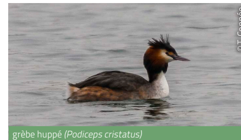
grèbe huppé ( Podiceps cristatus )