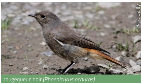
rougequeue noir ( Phoenicurus ochuros )