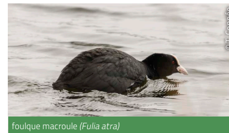
foulque macroule ( Fulvia atra )