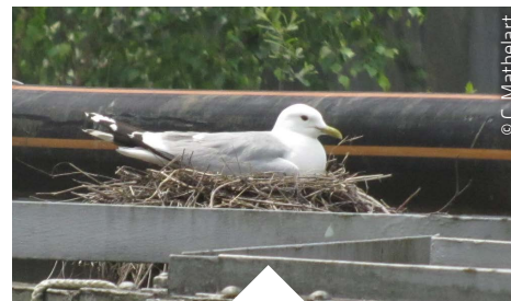
GOÉLAND CENDRÉ ( LARUS CANUS )