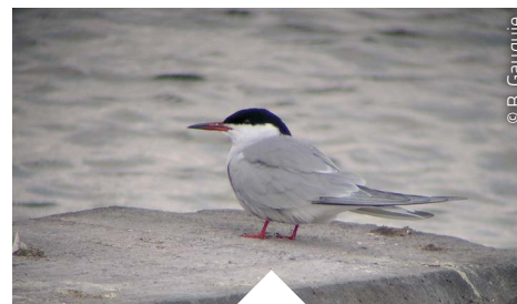
STERNE PIERREGARIN ( STERNA HIRUNDO )