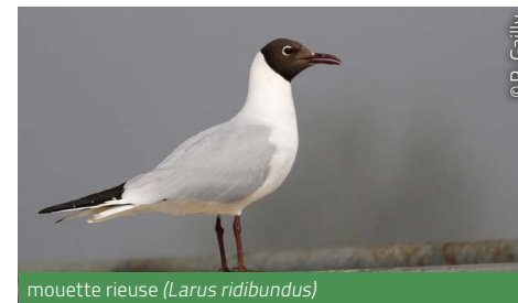
mouette rieuse ( Larus ridibundus )