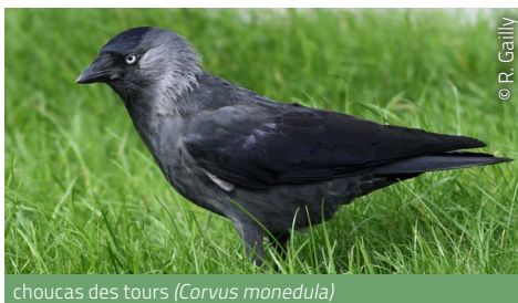
choucas des tours ( Corvus monedula )